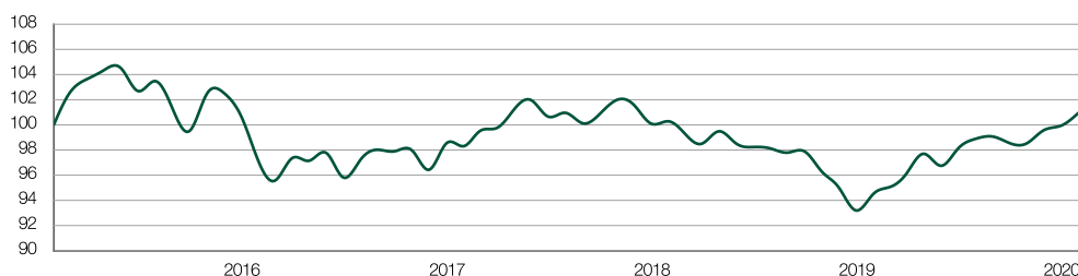
— UBAM CONVERTIBLES EUROPE 10-40

Performance sur 5 ans ou depuis le lancement. Source des données: UBP. Les fluctuations des taux de change peuvent avoir un impact positif ou négatif sur la performance. La performance passée n'est pas un indicateur fiable des résultats futurs. Les investissements peuvent voir leur valeur baisser ou croître.