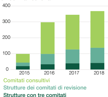
Maggiore supervisione da parte di direttori indipendenti - Società del TOPIX 500 con Comitati consiliari