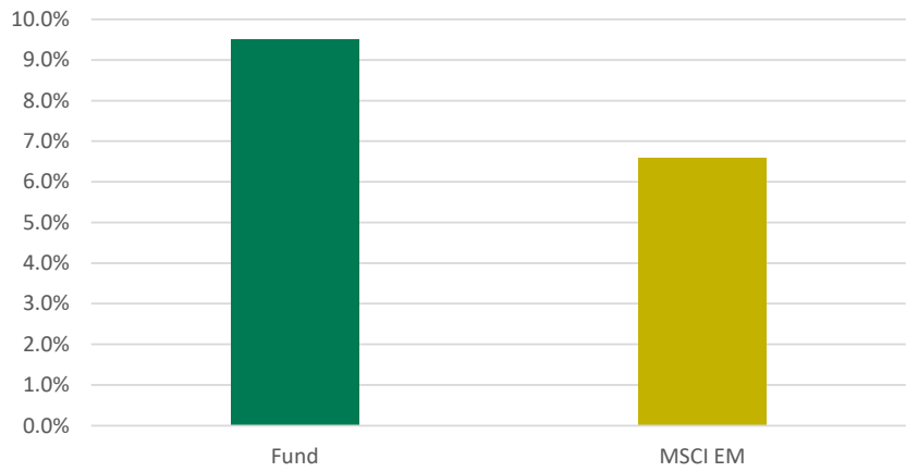
Pay Linked to Sustainability (%of companies)