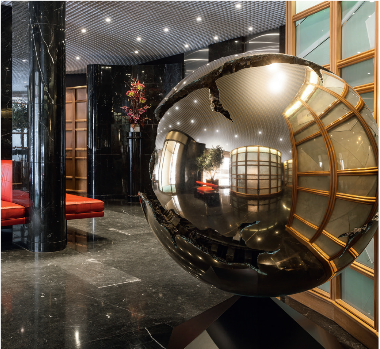
Sphere – Arnaldo Pomodoro 作品 私人收藏