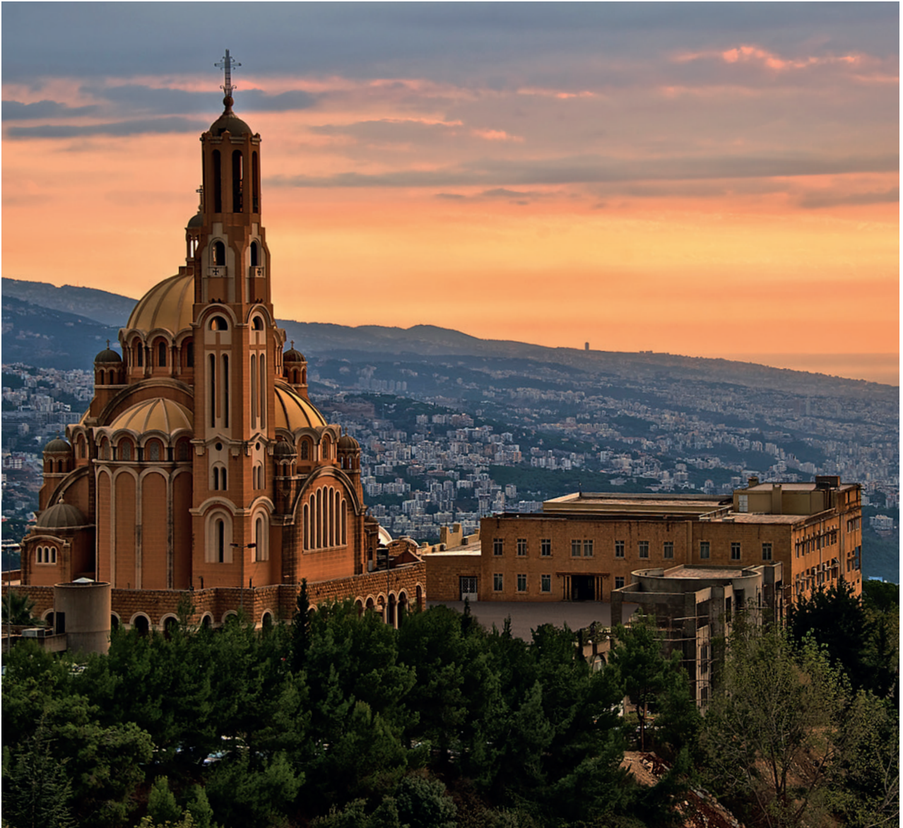
從Harissa村莊眺望貝魯特