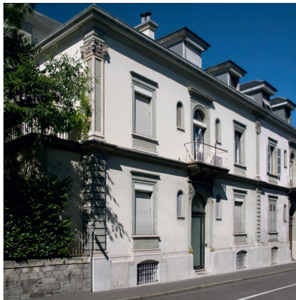
1972年CBI位於日內瓦 Cours des Bastions 的辦公室