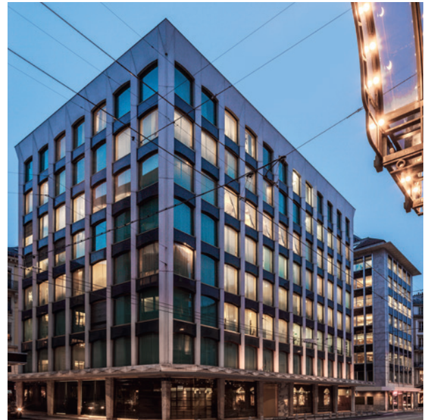
瑞聯銀行位於日內瓦96-98 rue du Rhône的總部

由開業之初，Edgar de Picciotto 已深明銀行必須發展至關鍵規模，而他當時有兩個選擇：透過內生增長或是大規模收購，而接下來便是眾所周知的發展。在小試鋒芒進行連串小型收購後，瑞聯銀行進一步拓展版圖，在1990年收購美國運通銀行，使規模瞬間擴大四倍，這項作價12億瑞士法郎的交易，當年更是瑞士史無前例最大宗的銀行收購計劃。時到今天，瑞聯銀行已合共完成接近20宗收購項目，其中包括在2002年收購DBTC、2011年收購荷蘭銀行、2013年收購萊斯銀行私人銀行部，以及2015年收購 Coutts International，為進一步發展亞洲市場開闢了門戶。最近期的收購項目包括在2021年11月收購 Millennium Banque Privée，以及在2022年1月收購 Danske Bank International。