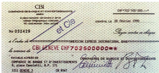
1990年2月28日收購美國運通銀行的支票

斷演進，擴展為今天備受推崇的金融機構，不但管理資產總值突破 1,000 億瑞士法郎，在全球約 20 個地點也聘用了接近 2,000 名員工。瑞聯銀行在這逾 50 年間所創的輝煌業績，是眾多歷史更悠久的銀行亦望塵莫及。