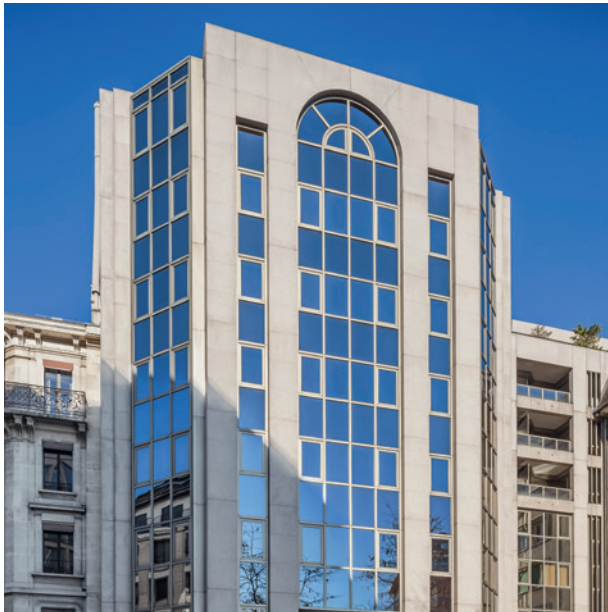
位於日內瓦8 Place Camoletti的銀行大樓

美國總統尼克遜（Nixon）在1973年突然取消金本位制度，終止美元與黃金兌換。當消息公布後，Edgar de Picciotto 隨即將銀行的資本兌換為黃金，並將手上的所有美元兌換為瑞士法郎。七年後，美元貶值一半，但金價卻由每安士70美元飆升至800美元。這個決定多年來使 Edgar de Picciotto 幾乎與黃金齊名。與此同時，Edgar de Picciotto 在一次美國之行中注意到對沖基金的巨大潛力，促使他成為首批認同透過外部專才和另類資產管理技巧獲取投資佳績的歐洲人之一。30年後，瑞聯銀行亦因為這個別具慧眼的決定採收豐碩成果，成為專精於對沖基金的龍頭銀行。