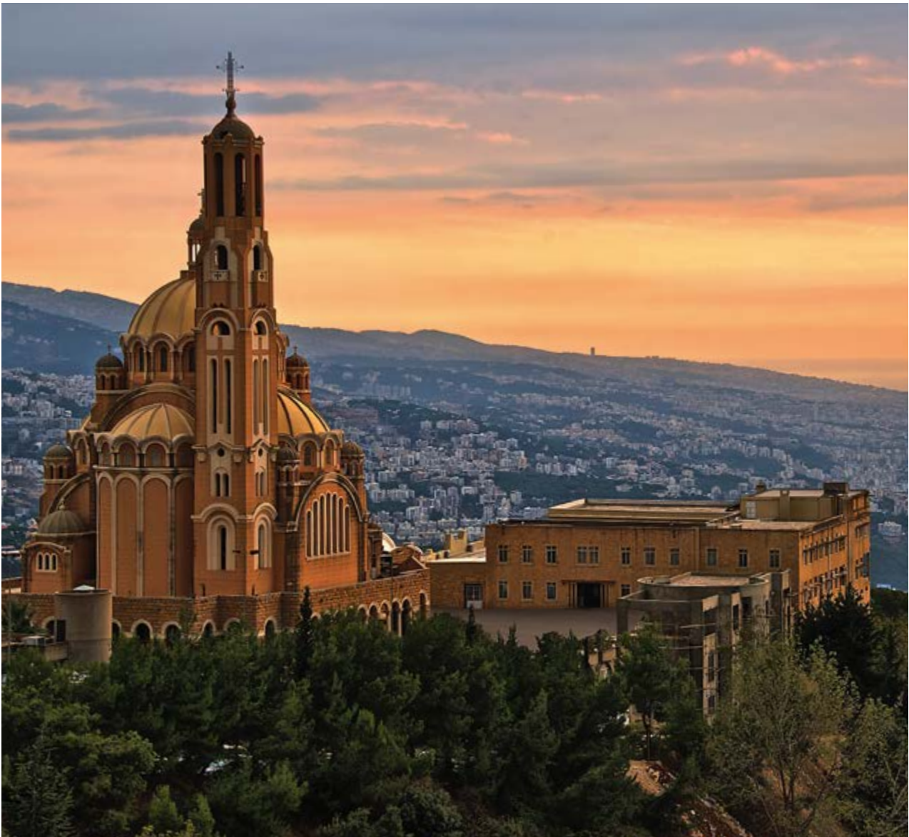
Вид на Бейрут из городка Харисса