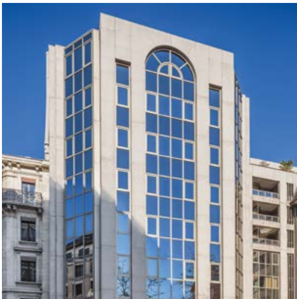
Здание на Пляс Камолетти, 8 в Женеве

В 1973 году президент США Никсон приостановил конвертируемость доллара в золото. Когда об этом стало известно, Эдгар де Пиччиотто немедленно перевел капитал Банка в золото, а все свои долларовые фонды в швейцарские франки. Семь лет спустя доллар обесценился вдвое, а золото выросло в цене с 70 до 800 долларов за унцию. Этот выбор свяжет имя Эдгара де Пиччиотто с золотом на долгие годы. Примерно в то же время, после поездки в Соединенные Штаты, он осознал весь потенциал хедж-фондов. Он был одним из первых людей в Европе, убежденных в том, что использование внешних талантов и альтернативных методов управления активами будут являться истинными критериями успеха. Тридцать лет спустя Банк будет пожинать плоды этого выбора, став лидером в секторе хедж-фондов.