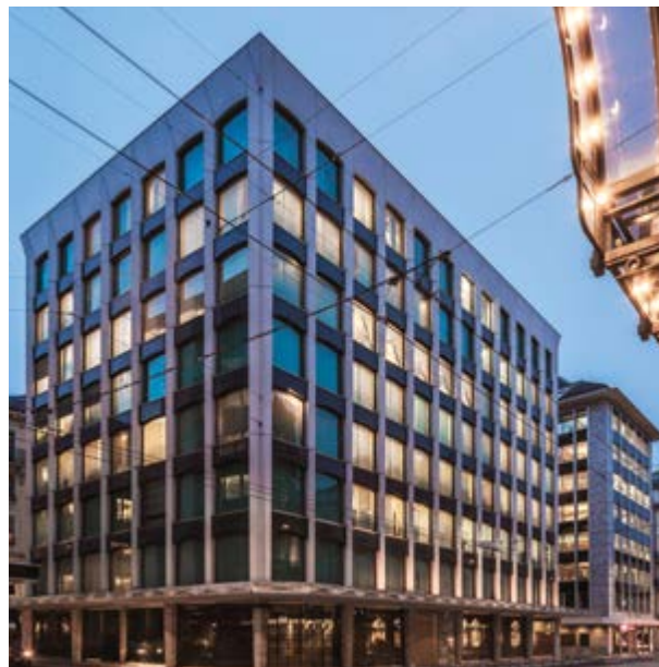
Головной офис UBP на Рю-дю-Рон, 96-98 в Женеве

С самого начала Эдгар де Пиччиотто знал, что Банк должен достичь критической массы, и для него существовало два варианта: органический рост или крупномасштабные поглощения. Остальное уже история. После первых небольших поглощений Банк увеличился в четыре раза с учетом присоединения Банка American Express в 1990 году. В то время эта сделка на сумму 1,2 млрд. швейцарских франков была самым крупным слиянием банков за всю историю в Швейцарии. На сегодняшний день Банк провел в общей сложности почти два десятка поглощений, включая несколько крупных сделок: DBTC в 2002 году, ABN AMRO в 2011 году, Lloyds Private Banking в 2013 году и Coutts International в 2015 году, что открыло ему двери в Азию.