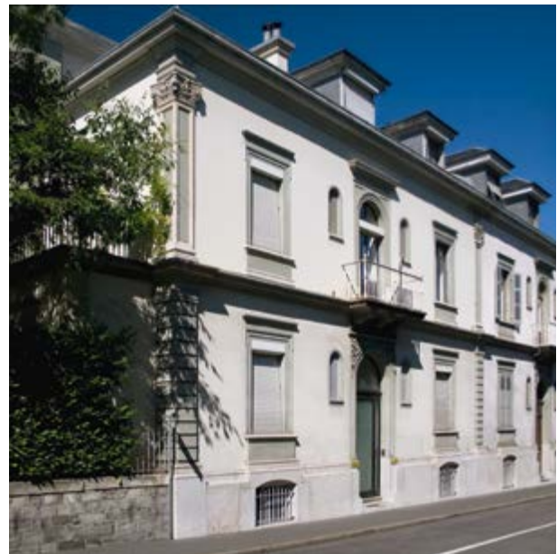
Sede della CBI, Cours des Bastions 6, a Ginevra, dal 1972