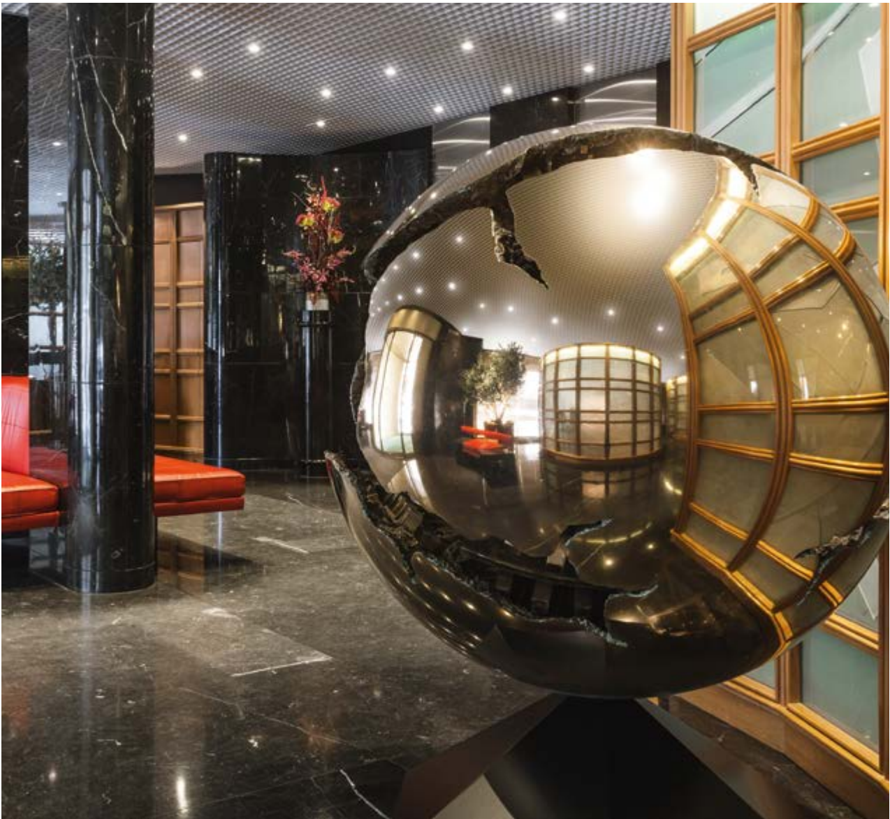
La Sfera, Arnaldo Pomodoro, collezione privata