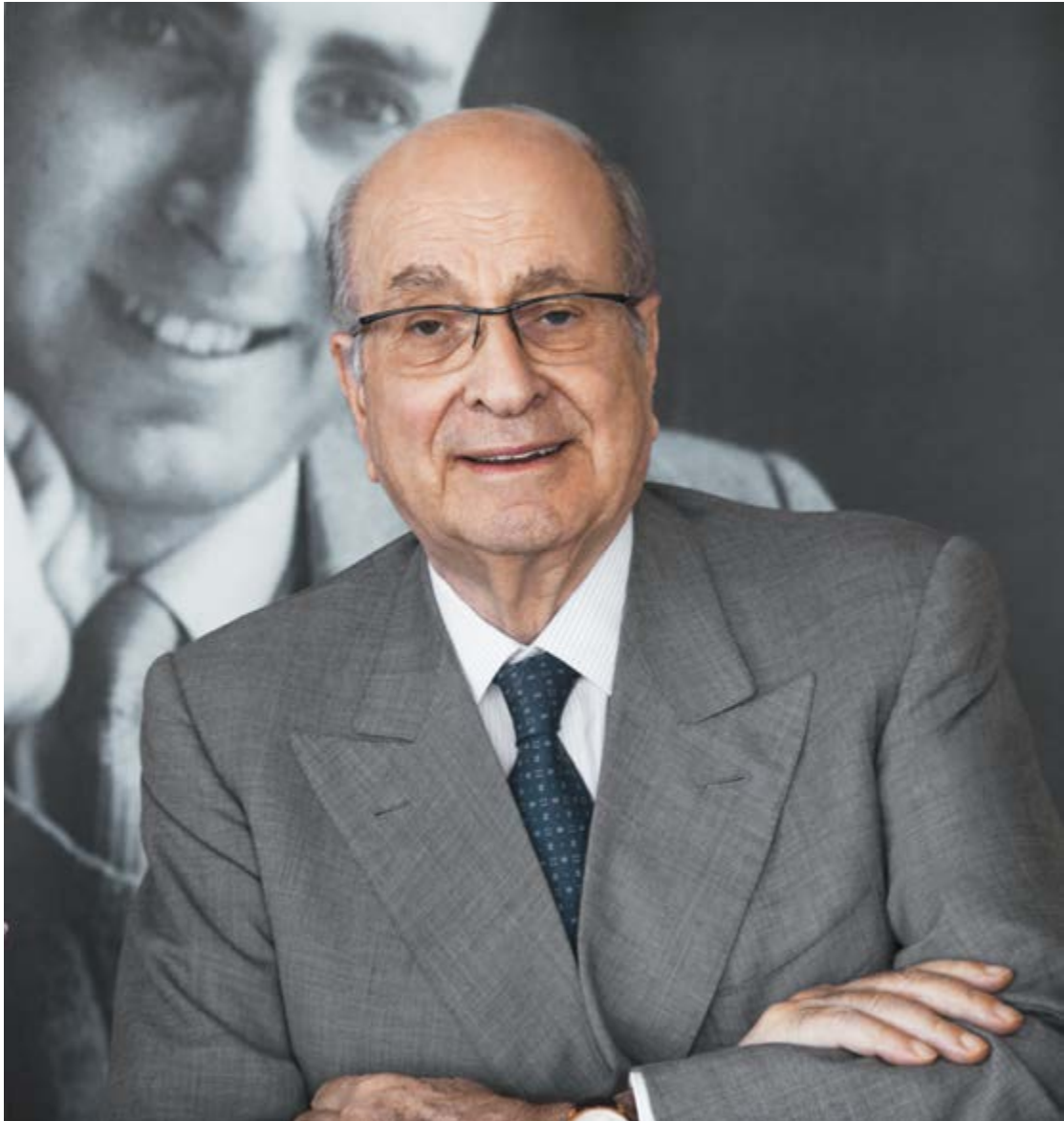
Edgar de Picciotto, Gründer der UBP