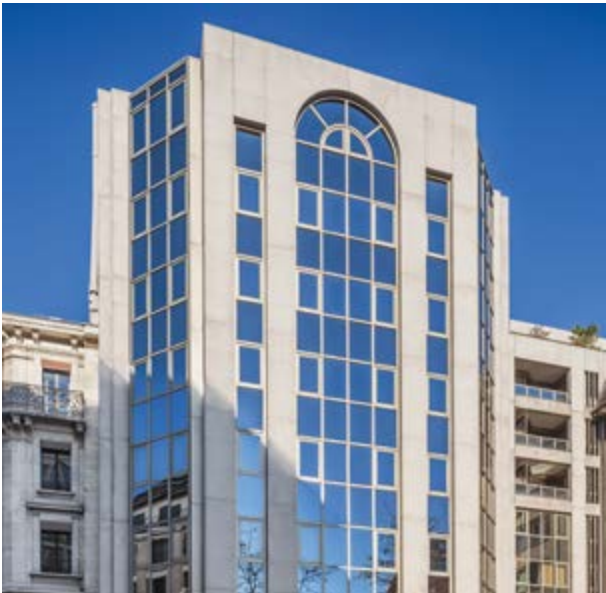
Bürogebäude, 8 Place Camoletti, Genf

US-Präsident Nixon hob im Jahr 1973 die Goldbindung des Dollars auf. Edgar de Picciotto tauschte nach Bekanntwerden der Nachricht sofort das Kapital der Bank in Gold und alle Dollarpositionen in Schweizer Franken um. Sieben Jahre später hatte der Dollar die Hälfte seines Wertes verloren, und der Goldpreis war von 70 auf 800 Dollar pro Feinunze gestiegen. Noch Jahre nach dieser Entscheidung sollte der Name von Edgar de Picciotto stets mit dem gelben Edelmetall assoziiert werden. Ungefähr zur gleichen Zeit erkannte er nach einem Aufenthalt in den USA, welches grosses Potenzial Hedgefonds beinhalten. Er gehörte zu den ersten Bankiers Europas, die der Überzeugung waren, dass die Beanspruchung von externen Spezialisten und der Einsatz alternativer Anlagestrategien zentrale Faktoren für den Erfolg sind. Dreissig Jahre später sollte seine Bank die Früchte dieser Entscheidung ernten und zu einem der führenden Institute in der Selektion von Hedgefonds aufsteigen.