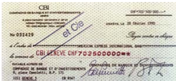
Der Scheck, der den Kauf der American Express Bank am 28. Februar 1990 besiegelte

bereits rund zwanzig Mitarbeiter an seiner Seite. Die Bank, die schliesslich im Jahr 1990 den Namen UBP erhielt, ist nach einem halben Jahrhundert stetigen Wachstums zu einem angesehenen Finanzinstitut geworden. Heute beschäftigt die UBP mehr als 1500 Mitarbeitende an weltweit über 20 Standorten, während die von ihr betreuten Kundenvermögen 100 Milliarden Schweizer Franken überstiegen haben. Die UBP hat in fünf Jahrzehnten mehr erreicht als manch anderes Finanzinstitut über Jahrhunderte.