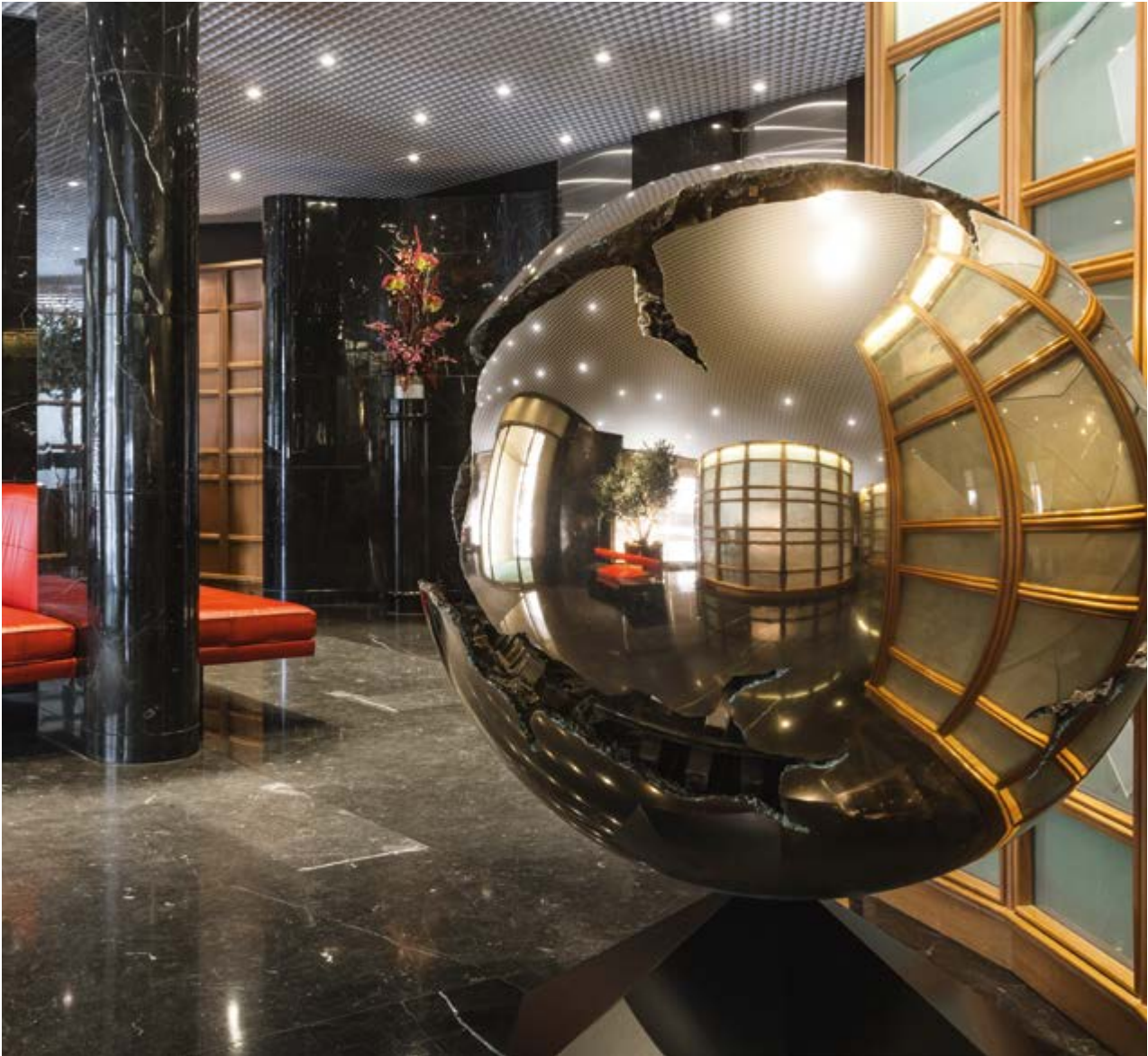
Kugel, Arnaldo Pomodoro, Privatsammlung