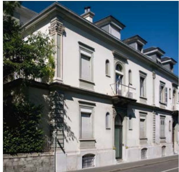
Die Räumlichkeiten der CBI am Cours des Bastions ab 1972